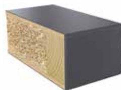
Plastkantlist NCS S 7502-B Laminat F2297 MAT