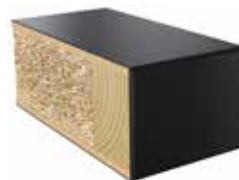
Plastkantlist NCS S 9000-N Laminat F2253 MAT