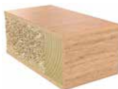
Plastkantlist ek 03 Laminat F7603 MAT