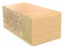
Plastkantlist björk Laminat F7921 MAT