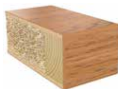
Plastkantlist ek 49 Laminat F6149 MAT