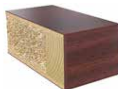
Plastkantlist mahogny Laminat F7008 MAT