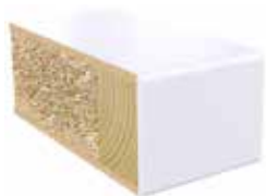
Plastkantlist NCS S 0502-G50Y Laminat F1040 MAT

Det finns massor av möjligheter att designa din egen laminatdörr från Swedoor. Vi kan nu erbjuda ett sortiment av laminatdörrar med plastkantlist där kantlisten har samma kulör som dörrbladsytan. Du kan välja mellan dörrar i gråskalan, allt från vita dörrar till svarta dörrar, men du kan också välja dörrar i hela färgskalan. Här ser du de olika valmöjligheterna.