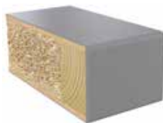
Plastkantlist NCS S 5000-N Laminat F7928 MAT