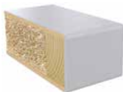
Plastkantlist NCS S 2500-N Laminat F7927 MAT