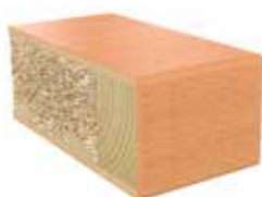
Plastkantlist bok Laminat F0190 MAT